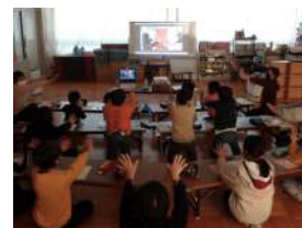
(写真上) 重点支援校に訪問し 現場スタッフへヒア リング