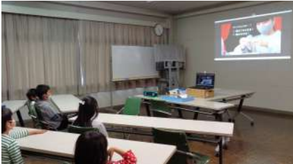
(写真) スクリーンに映る先生に子どもたちも釘付け！

みんなのアフタースクールwinterでは、パートナー企業様との協働プログラムも実施いたしました。そのうち、木村石鹼工業株式会社様とのプログラムでは、元々出前授業として実施していたプログラムをオンラインバージョンに変更し、子どもたちの体験パートも含めた「おそうじマジックショー」としてプログラムを実施いたしました。