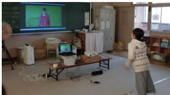
(写真) 画面の向こうの先生と、ボールがあるつもりでキャッチボール！

コロナ禍をきっかけに、様々な活動制限を強いられた全国の子どもたち。そんな中でも、学び×遊び×成長の場を止めないよう、公益財団法人日本財団様の助成のもと、オンラインでプログラムをお届けする「みんなのアフタースクール」を、全国の学童保育・放課後子ども教室を対象に開催しました。サイエンス、食育、語学などの学び系プログラムの他にも、歌舞伎役者・舞台女優・世界の裏側から登場する市民先生との交流プログラムなど、幅広いジャンルのプログラムを用意し、子どもたちに新たな出会いと豊かな体験をお届けしました。