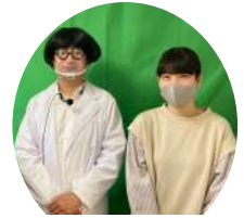
木村石鹼工業株式会社 金様・林様

オンラインで行うのは初めてでしたが、リアルタイムで子どもたちの反応も見ることができ、嬉しかったです。全国どこでも繋がることのできるためオンラインで全国各地を回りたいと思いました。