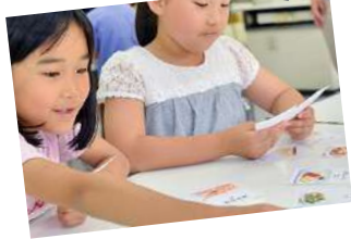
現地に赴いての出前授業