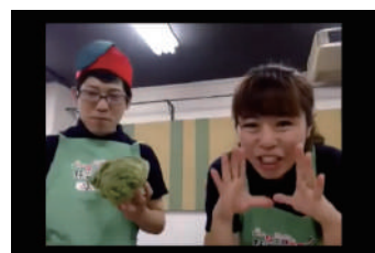
エプロン着用でリアル感を演出！