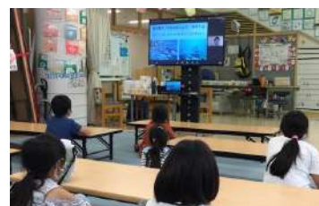
「海の魅力」がテーマのセッション時の様子

他にも様々な企業様と話を重ねながら、二人三脚でオンラインプログラム開発に着手しています。コロナと共に過ぎていかなければならない現在、それでも子どもたちに豊かな遊びや学びの機会を届けられるよう、現地に訪問するプログラムとオンラインでの遠隔プログラムのそれぞれの長所を活かしながら、これからもみなさまとの協業を続けてまいります。