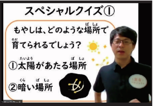
アフタースクール（当団体運営）でのオンラインプログラムの様子