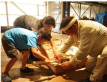
地元の大工さんと家づくり！