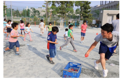
大学生と思いっきり遊んだりも！

大人の都合を優先した制度ではなく、子どもたちの願いを叶える放課後を、日本全国で！ ぜひ、放課後の価値を社会に伝えるために、私たちの挑戦を広くメディアの皆様にご注目いただけますと幸いです。