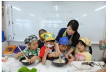
保護者の方と料理プログラム