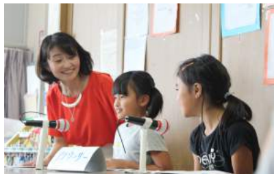
出張プログラム 「ことばと健康」