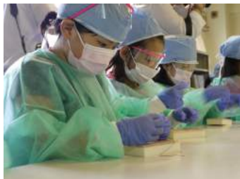
出張プログラム 「心臓外科医のシゴト」

本プロジェクトでは、地域を巻き込んで子どもを育てる「アフタースクールモデル」を広げるために、 現場経験豊富なNPOのノウハウと、全国ネットワークを持ち、地域のつながりを大切にする保険会社の強みを掛け合わせたこと で国内初の全国規模での学童保育等支援を成功させているという点がこの度の受賞につながり、また 企業とNPOの協働のお手本にもなる事例と評価 をいただきました。