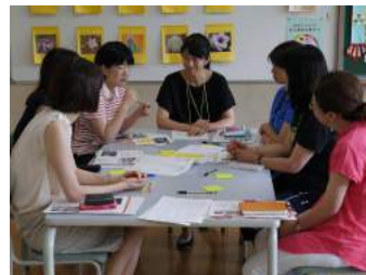
現地団体スタッフや地域の大人を対象に 同時開催している「アフタースクール勉強会」