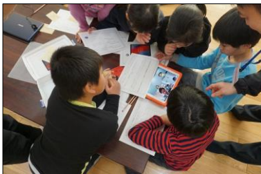
協力して謎解きに挑戦（謎解きプログラム）