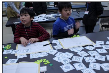
カードを用いたアイデア出し（ブレストプログラム）