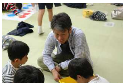
武田薬品工業株式会社さま

昨今、企業のボランティア休暇制度の充実や有給取得推進に向けた人事制度の整備が積極化しています。社員の成長や社会への貢献を目的としたボランティア参加は年々増加傾向にあり、当団体でも積極的に受け入れをしています。