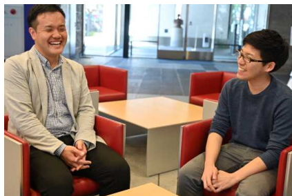
男性職員の育児休暇実績もあります