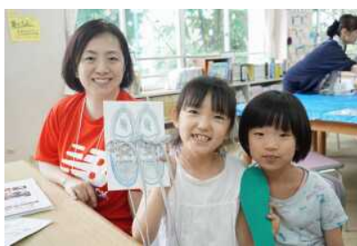
株式会社ニューバランスジャパンさま