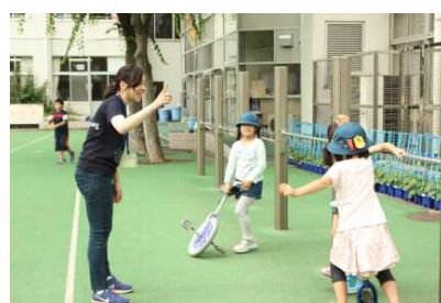
株式会社セールスフォース・ドットコムさま