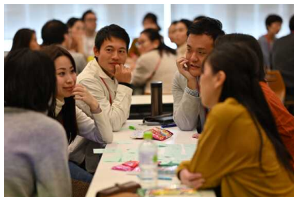
お互い様ミーティングの様子