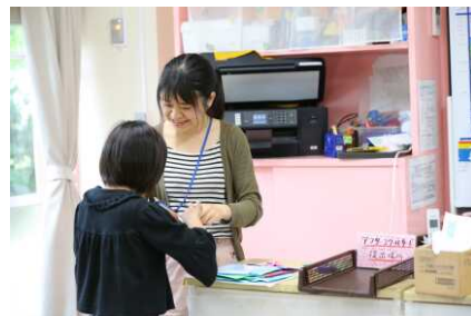
一人ひとりに合わせた柔軟な働き方を