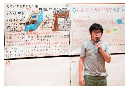
区長を含めた大人への提案発表

2019年度は3年目を迎えました。過去に参加した子どもたちの中には、Tシャツやピブスをデザインした子、地域のガイドマップを作成した子、案内ステッカー作成費をクラウドファンディングで集める子、など各々が地域の方のお力添えの元活動しています。8月10日（土）PMには、提案の実現に向けて自らが主体となり、どのような活動をしてきたのかを報告する場も用意しています。子どもたちがどのように一歩を踏み出し、地域と関わって街づくりに貢献しているのか、子どもたちの力を感じていただければと思います。