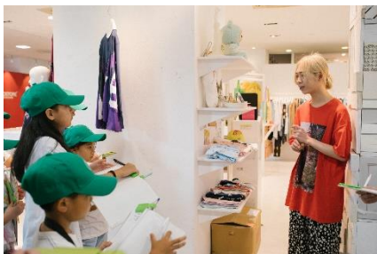
原宿のお店でインタビュー