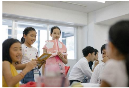
チームでビジョン作成