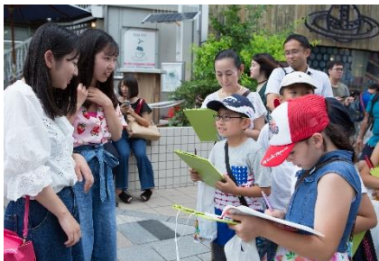
原宿を訪れる人への街頭インタビュー