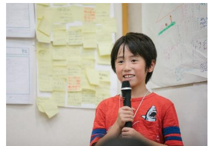
区長を含めた渋谷区への提案発表

2018年度は過去に参加した子どもたちより、提案の実現に向けて自らが主体となり、どのような活動をしてきたのかの報告も実施します。子どもたちがどのように一歩を踏み出し、地域と関わって街づくりに貢献しているのか、子どもたちの力を感じていただければと思います。